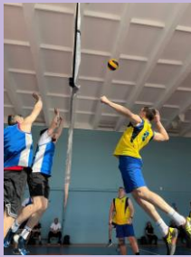
Соревнование по волейболу среди молодых педагогов города