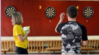
Соревнование по дартсу среди молодых педагогов города