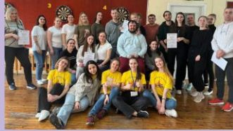
Спартакиада молодых педагогов. Соревнование по настольному теннису