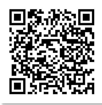
Приказ ДОИМ №682 от 12.11.2021г.

Повышение качества обучения детей с ОВЗ на всех уровнях образования