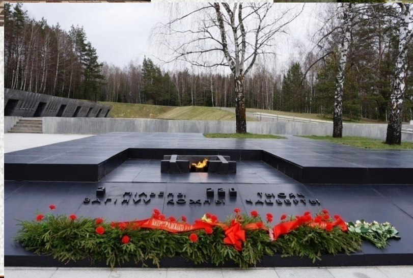
Мемориальный комплекс «Хатынь»