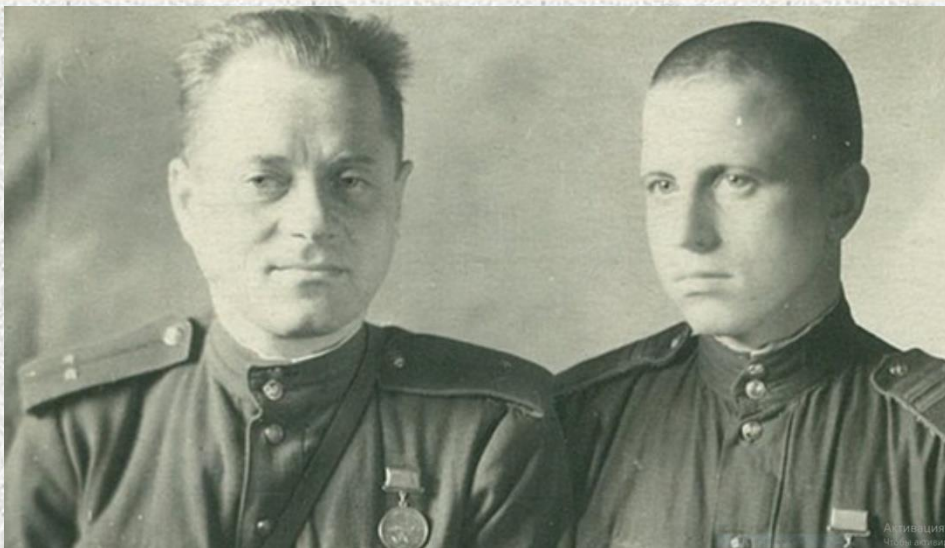
1944 год. Слева мой отец.

Многие мои родственники были участниками войны или тружениками тыла, впрочем, как и весь наш советский народ.