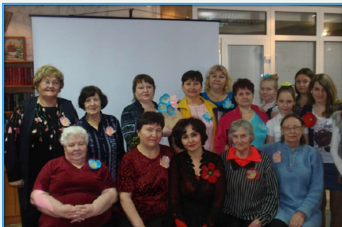
Социально-образовательный проект «Поделись теплом души своей...»