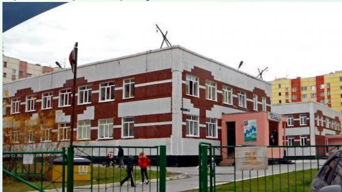
Структурное подразделение «Академгородок»