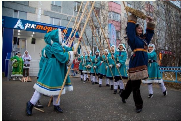
Структурное подразделение Музейно-образовательный комплекс этнопарк «Аркториум»