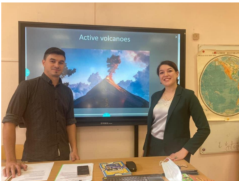
Разбор лексики и грамматики на английском языке